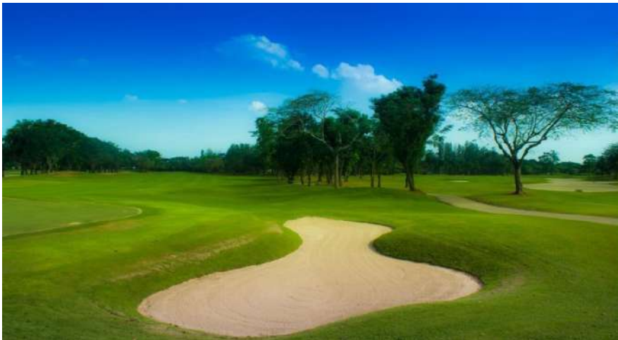
สนามกอล์ฟ จัดเป็นธุรกิจการกีฬา จึงได้รับการลดภาษี

1.4 ลดภาษีร้อยละ 90 ของจำนวนภาษีที่จะต้องเสียของทรัพย์สินที่ใช้เป็นสถานที่เล่นกีฬา สวนสัตว์ สวนสนุก หรือที่จอดรถสาธารณะ