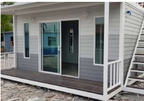
บ้านประกอบเสร็จ