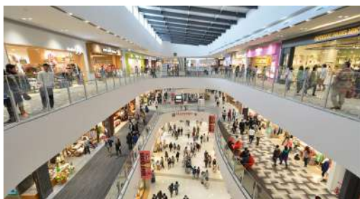
ห้างสรรพสินค้า