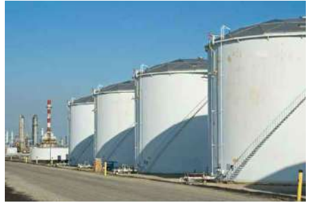
ถังเก็บน้ำมันบนดิน