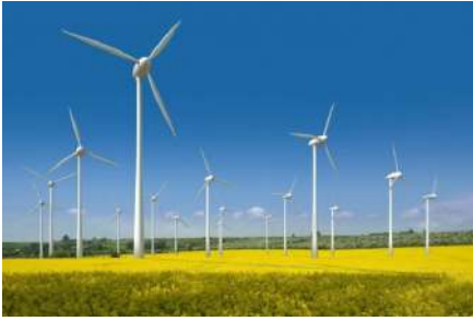
กังหันลม

ตัวอย่างสิ่งปลูกสร้างที่อยู่ในข่ายได้รับการยกเว้นภาษี