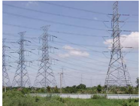
เสาไฟฟ้า