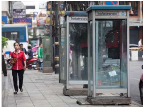
ตู้โทรศัพท์สาธารณะ