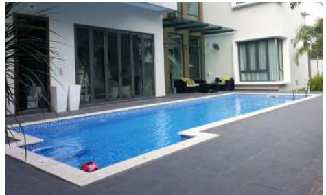
สระว่ายน้ำ