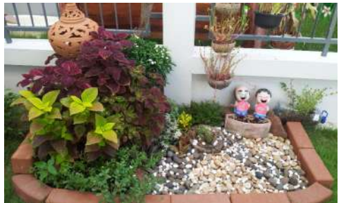
สวนหย่อม