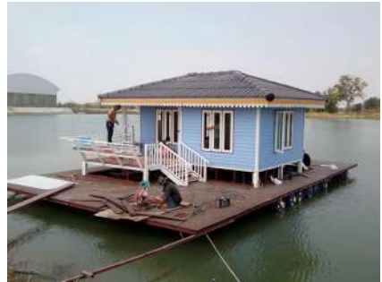
บ้านเรือนแพ