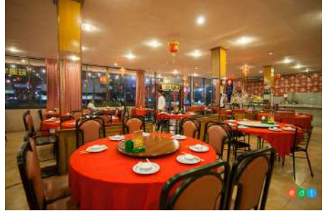
ภัตตาคาร