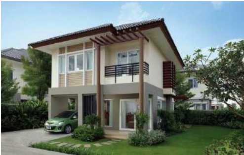
บ้านเดี่ยว