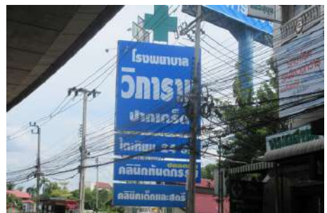
ตัวอย่างป้ายที่ต้องเสียภาษี

หากในกรณีที่ไม่มีผู้มาขึ้นแบบแสดงรายการภาษีป้าย หรือเจ้าหน้าที่ไม่สามารถติดต่อหรือหาตัวเจ้าของป้ายได้ ให้ถือว่าผู้ครอบครองป้ายมีหน้าที่เสียภาษีป้าย แต่ถ้าหาตัวผู้ครอบครองป้ายไม่ได้ เจ้าของหรือผู้ครอบครองที่ดินที่ติดตั้งป้ายจะต้องเป็นผู้เสียภาษีป้ายแทน ตามลำดับที่กล่าวมา