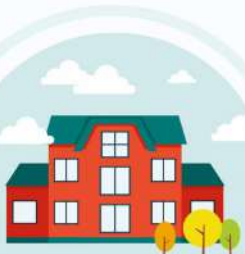
ผู้มีบ้านพักอาศัย