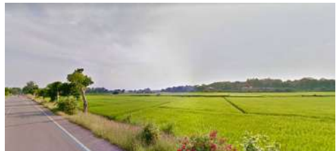
ที่ดินที่ใช้ทำกิจกรรม