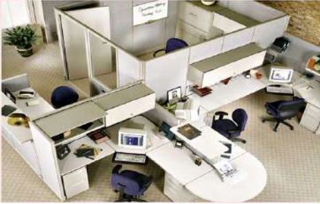
สำนักงาน