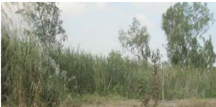
ที่ดินรกร้างไม่ได้ใช้ประโยชน์

(2) ที่ดินที่ไม่เป็นกรรมสิทธิ์ของบุคคลธรรมดาหรือนิติบุคคล แต่อยู่ในความครอบครองของบุคคลธรรมดาหรือนิติบุคคล เช่น สปก. 4, ก.ส.น., ส.ค.1, นค.1, นค.3 ส.ท.ก.1 ก, ส.ท.ก.2 ก, นส.2 (ใบจอง) และที่ดินอันเป็นทรัพย์สินของรัฐ ซึ่งมีการเข้าไปครอบครองหรือทำประโยชน์ ฯลฯ เป็นต้น