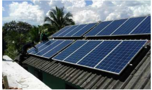
แผงโซลาเซลล์