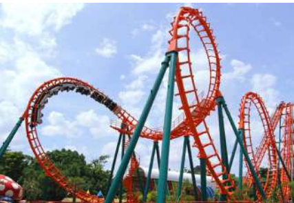
เครื่องเล่นในสวนสนุก