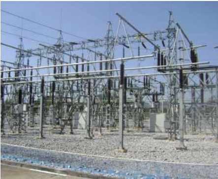
ลานโกไฟฟ้า