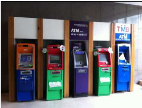
ตู้ฝากถอนเงินสด

ตัวอย่างสิ่งปลูกสร้างที่อยู่ในข่ายได้รับการยกเว้นภาษี